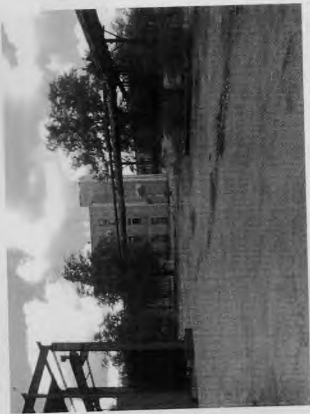
Материалы фотофиксации земельного участка с кадастровым номером 34:34:010015:93