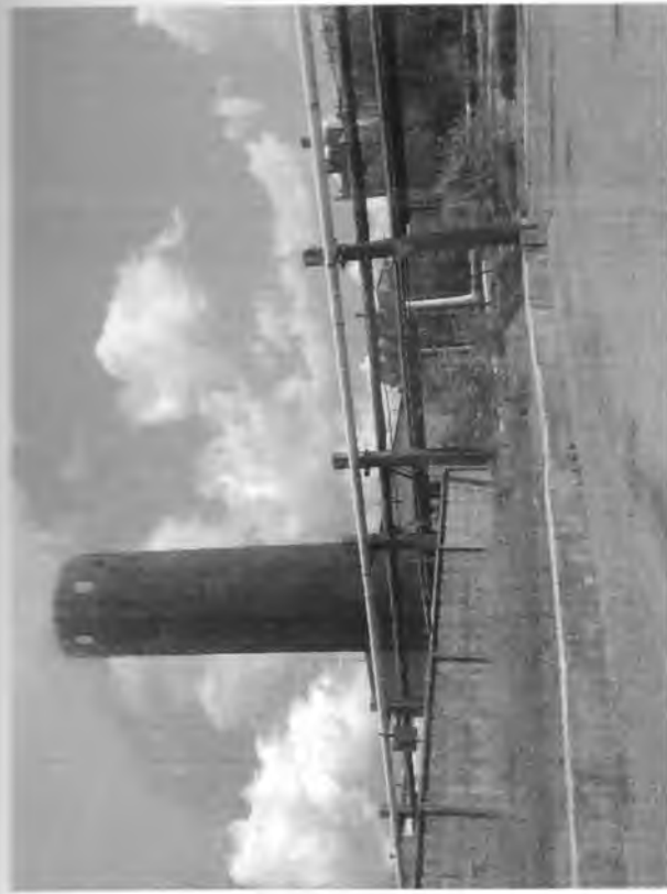
Материалы фотофиксации земельного участка с кадастровым номером 34:34:010015:93